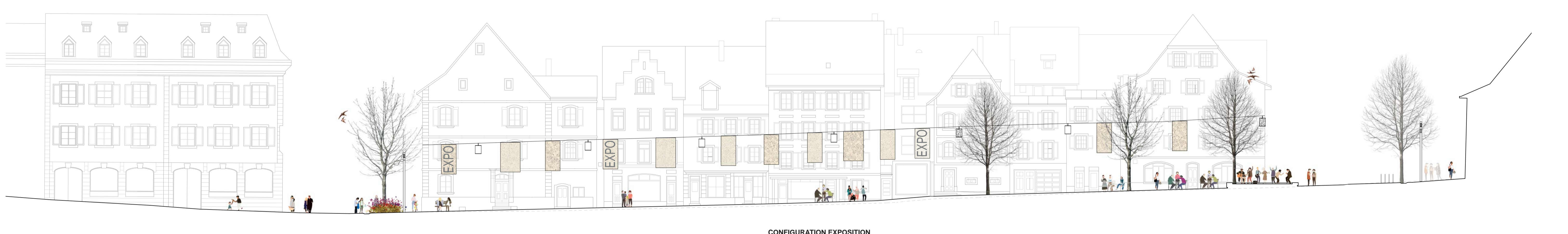
VUE 3 - 1:200 CONFIGURATION EXPOSITION Place de la Liberté Rue du 23 Juin Place Roland Béguelin Rue de l'Hôpital