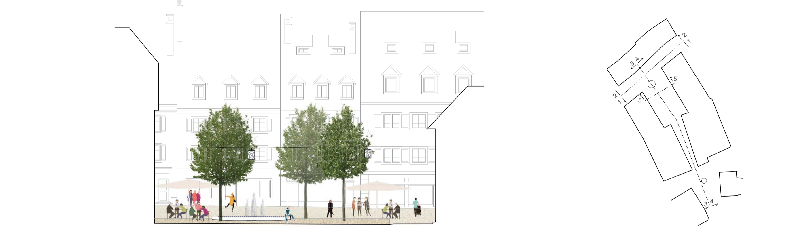
VUE 5 - 1:200 CONFIGURATION JEU D'EAU Place Roland Béguelin