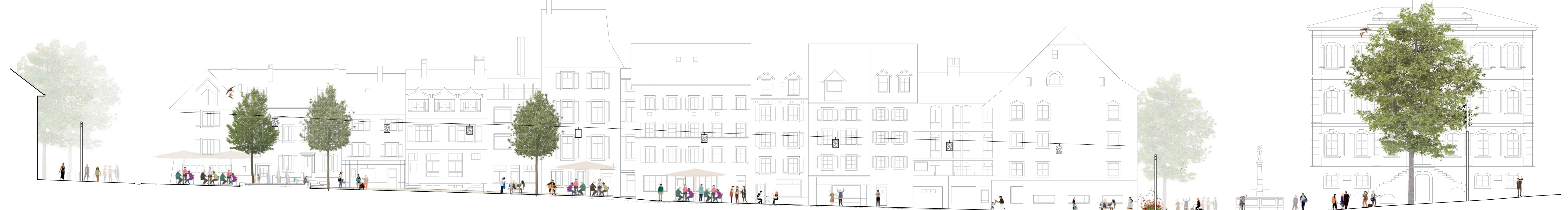
VUE 4 - 1:200 CONFIGURATION JOURNALIÈRE Rue de l'Hôpital Rue du 23 Juin Place de la Liberté