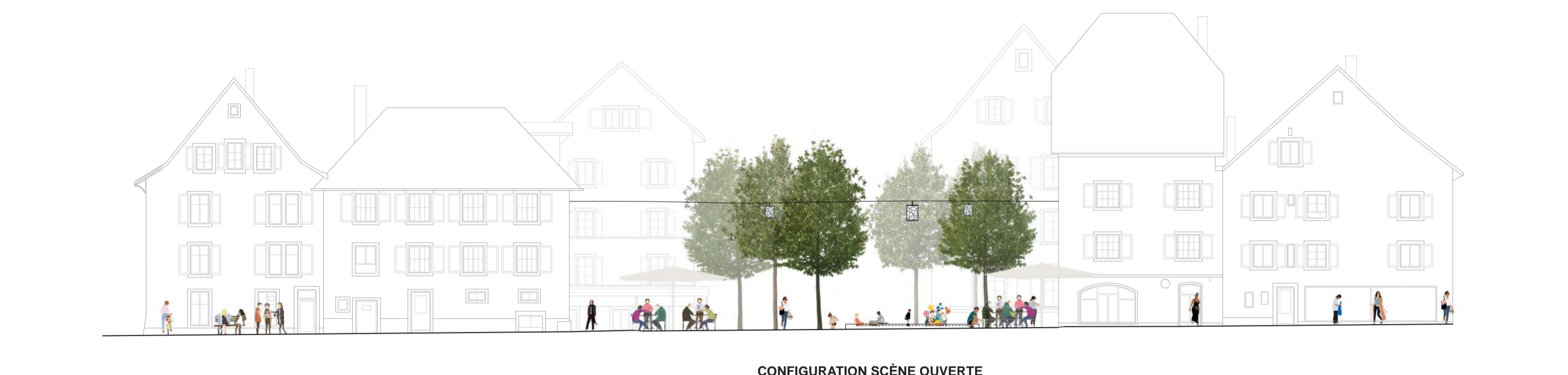
VUE 1 - 1:200 CONFIGURATION SCÈNE OUVERTE Rue de l'Hôpital Place Roland Béguelin Rue de l'Hôpital