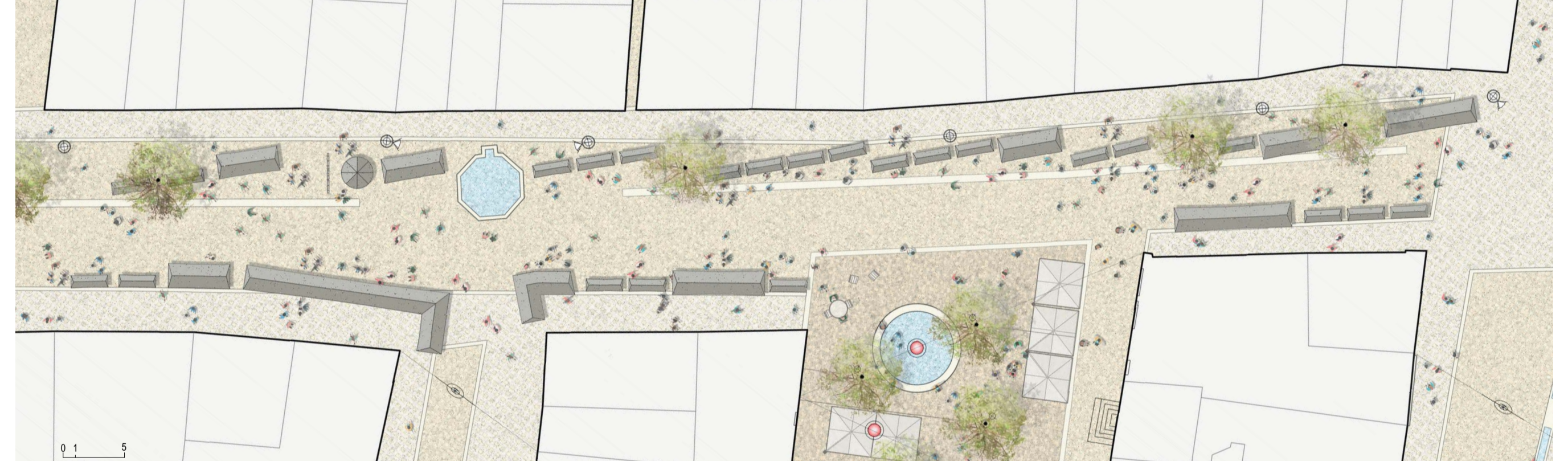
CONFIGURATION MARCHÉ HEBDOMADAIRE