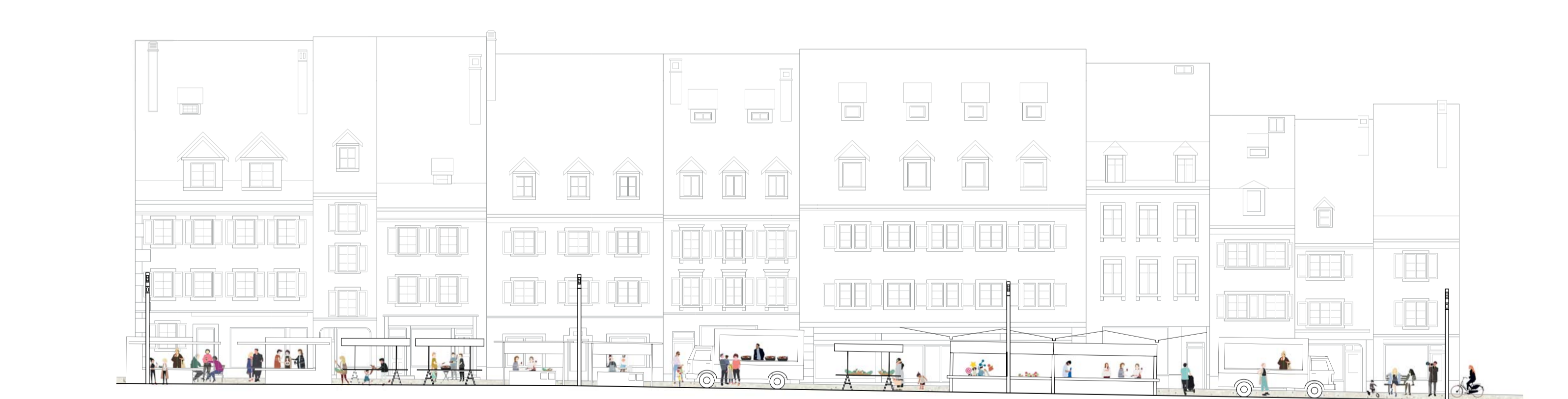
VUE 2 - 1:200 CONFIGURATION MARCHÉ HEBDOMADAIRE Rue de l'Hôpital