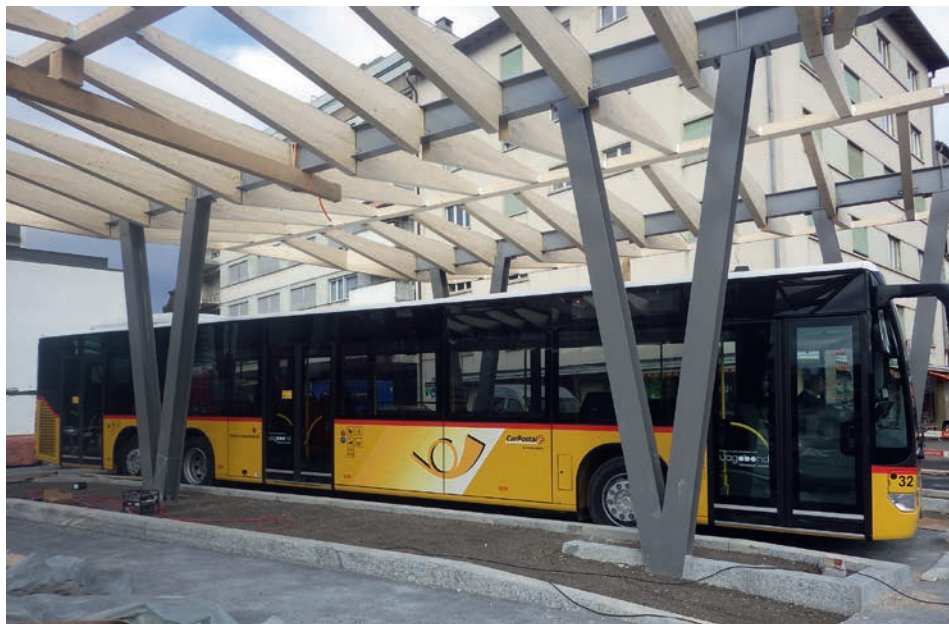
Structure en cours de réalisation... mais déjà utilisée

des parties couvertes est assuré par des lampes LED encastrées.