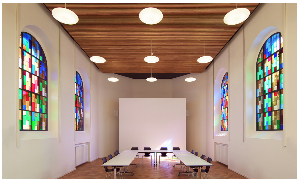
SALLE MULTIMEDIA (ANCIENNE CHAPELLE)

En dernière intervention, les aménagements extérieurs ont été adaptés et remis aux normes actuelles de sécurité. La place de jeux et les installations pour la pratique de différents sports ont été modernisées.